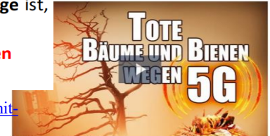
Bild anklicken, um das Video auf Legitim anzusehen.

http://scienceblogs.de/kritisch-gedacht/2019/09/25/ein-5g-experiment-und-eine-begegnung-mit-der-5g-sekte/